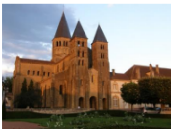
Paray le monial