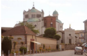
Ars sur formans