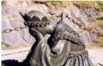
Notre Dame de La Salette