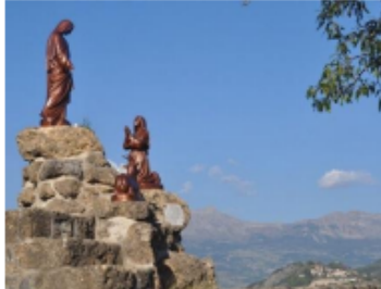
Notre Dame du Laus