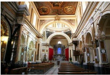
Sanctuaire Sainte Philomène