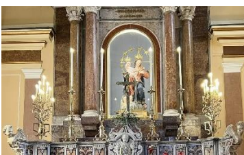
Sanctuaire Sainte Philomène