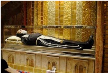
Saint Padre Pio

Découverte du sanctuaire de Saint Padre Pio, visite de la première basilique dédiée à Notre Dame des Grâces. Visite de la chapelle de l'antique couvent des capucins Messe. Déjeuner. Après-midi visite de la nouvelle basilique. Passage dans la crypte où repose le corps intact de Saint Padre Pio dans une chasse de verre. Temps de prières. Temps libre. Diner et nuit.