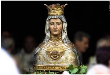
Sainte Anne d'Apt