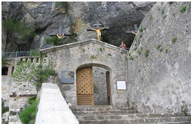
La Sainte Baume