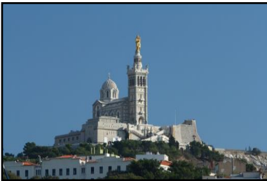
Notre Dame de la Garde Marseille