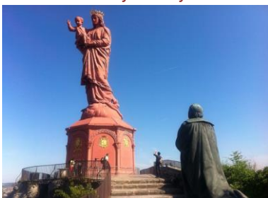
Notre Dame de France, le Puy en Velay