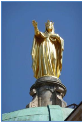
Notre Dame des Grâces Cotignac