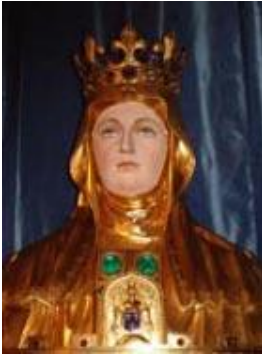
Sainte Marthe à Tarascon