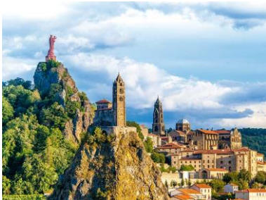
Le Puy en Velay