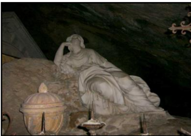
Sainte Marie Madeleine